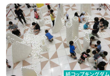
紙コップキングダム