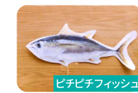
ピチピチフィッシュ