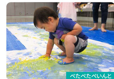
ぺたぺたぺいんと

体をつかってダイナミックな絵の具あそびをします。 ※衣服や会場が絵の具で汚れます。(養生シートは持参します)