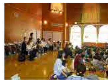
保育園のお誕生会 見学