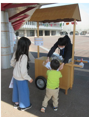
屋外や館内で配布しました

また、新聞にも取り上げていただき、事務局のスタッフがラジオやテレビなどにも出演し、更なるPRを行いました。