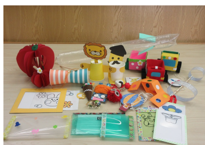
趣向を凝らした工作の数々