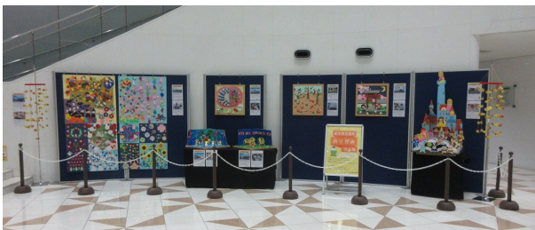
おりがみ作品展の全体の様子 (左：メインホール 右：2階エレベーターホール付近)

毎年恒例の「おりがみ作品展」。今年度は「みんなでスポーツ」と「フリー」の2つのテーマで募集しました。その結果、下記の7館・計8点の作品が集まりました。実施予定期間中に会場である科学館が緊急事態宣言発令のため、臨時休館となり、開催が危ぶまれましたが、日程を変更して無事開催となりました。会場の都合上開催当初は、1Fのメインホールで、3月2日からは2階のエレベーターホール付近で展示。家族連れや、幼稚園・保育園などの団体の皆さんの目を楽しませてくれました。会場では、「おりがみでこんなことができるんだね。」「どうやってつくるのかな?」「前に行った、〇〇児童館の作品だね。」などの声が聞かれました。お時間がありましたら、ぜひお越しください。